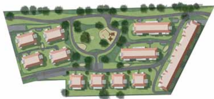
Der Lageplan der Wohnanlage Südlicht 11.

4-Zimmer-Wohnungen entstanden. Mit der durchgehend schwellenfreien Gestaltung jeder einzelnen Wohnung zeigt die Baugenossenschaft Steglitz herausragende Fortschrittlichkeit, denn der Standard ist selbst im barrierefreien Wohnungsbau bis heute erfahrungsgemäß bundesweit der Einbau von Außentürschwelle zwischen 1 und 15 cm Höhe. Die durchgängige Schwellenfreiheit dieser Wohnanlage im Töpchiner Weg ermöglicht eine komfortable Nutzbarkeit für alle Mieter und eine anpassungsfähige Vermietbarkeit für die GBSt. Die Gestaltung der Wohnungen überzeugte die Mitglieder der Baugenossenschaft, im Februar 2016 konnten die letzten freien Wohnungen vergeben werden.