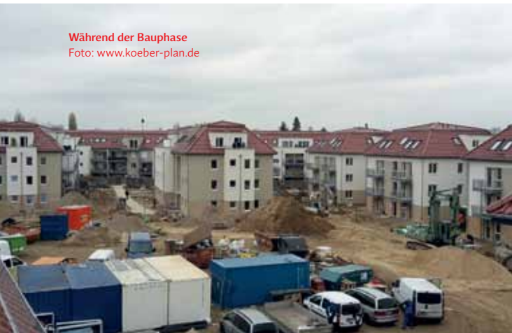
Während der Bauphase