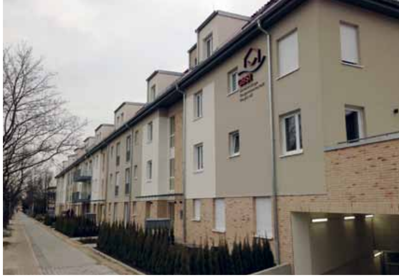
Da nur schwellenfreie Außentüren den Bedarf ihrer Mitglieder nachhaltig erfüllen, plant die GBSt gleich im nächsten Bauvorhaben die schwellenlose Magnet-Doppeldichtung wieder einbauen zu lassen.