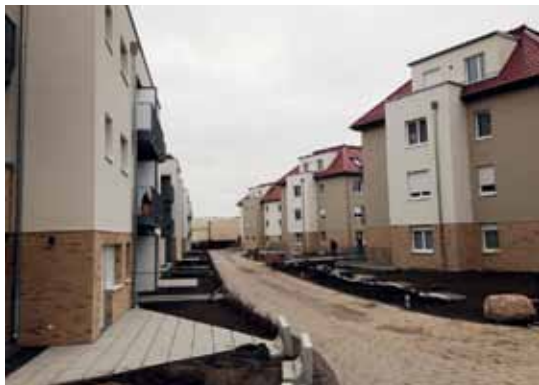
Die Wohnanlage Südlicht 11.