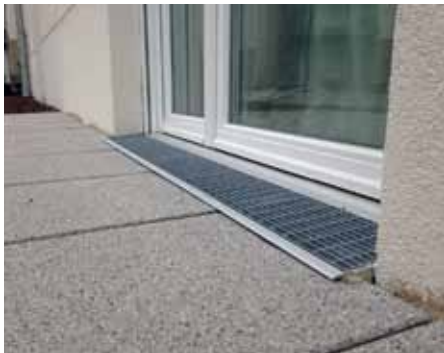
Die Magnet-Doppeldichtung mit direkt anschließender Rinne von ALUMAT.

Flexible Anpassbarkeit: Auf diesem Bild (oben links) ist die eingebaute Magnet-Doppeldichtung noch ohne Fertigfußboden im Innenraum zu sehen. Die Baugenossenschaft Steglitz aus Berlin hat Ihren Mitgliedern ermöglicht zwischen 4 verschiedenen Farbtönen eines Linoleum-Bodenbelags zu wählen, was überwiegend in Anspruch genommen wurde. Es gab jedoch auch die Möglichkeit einen anderen Fußbodenbelag selbst zu verlegen. Falls die Fußböden folglich eventuell über geringere Aufbauhöhen verfügen, kann das Aluminium-Bodenprofil der Magnet-Doppeldichtung diesen Höhenunterschied problemlos ausgleichen. Es muss in solchen Fällen nur leicht nach unten geklopft werden.