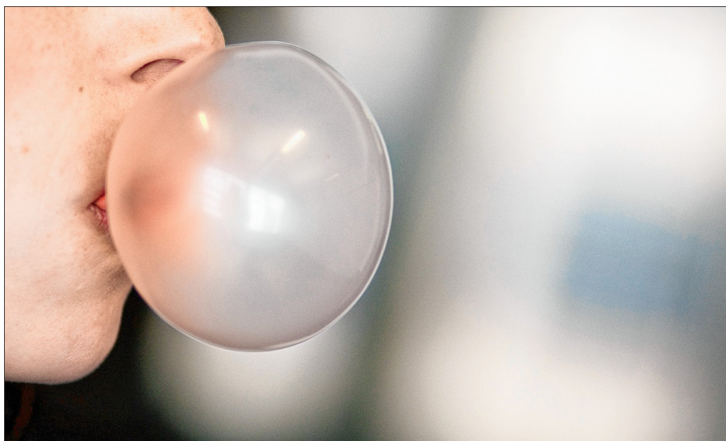
Blase aus Kaugummi: Früher bissen Menschen im heutigen Skandinavien noch auf dem Harz von Birken herum.

Es diene der Konzentration und helfe bei Stress. Nicht ohne Grund sieht man viele Sportler vor wichtigen Spielen, wie sie sich schmatzend an ihrem Erdölderivat abarbeiten. Denn dies ist die Grundsubstanz moderner Kaugummis – versetzt un-