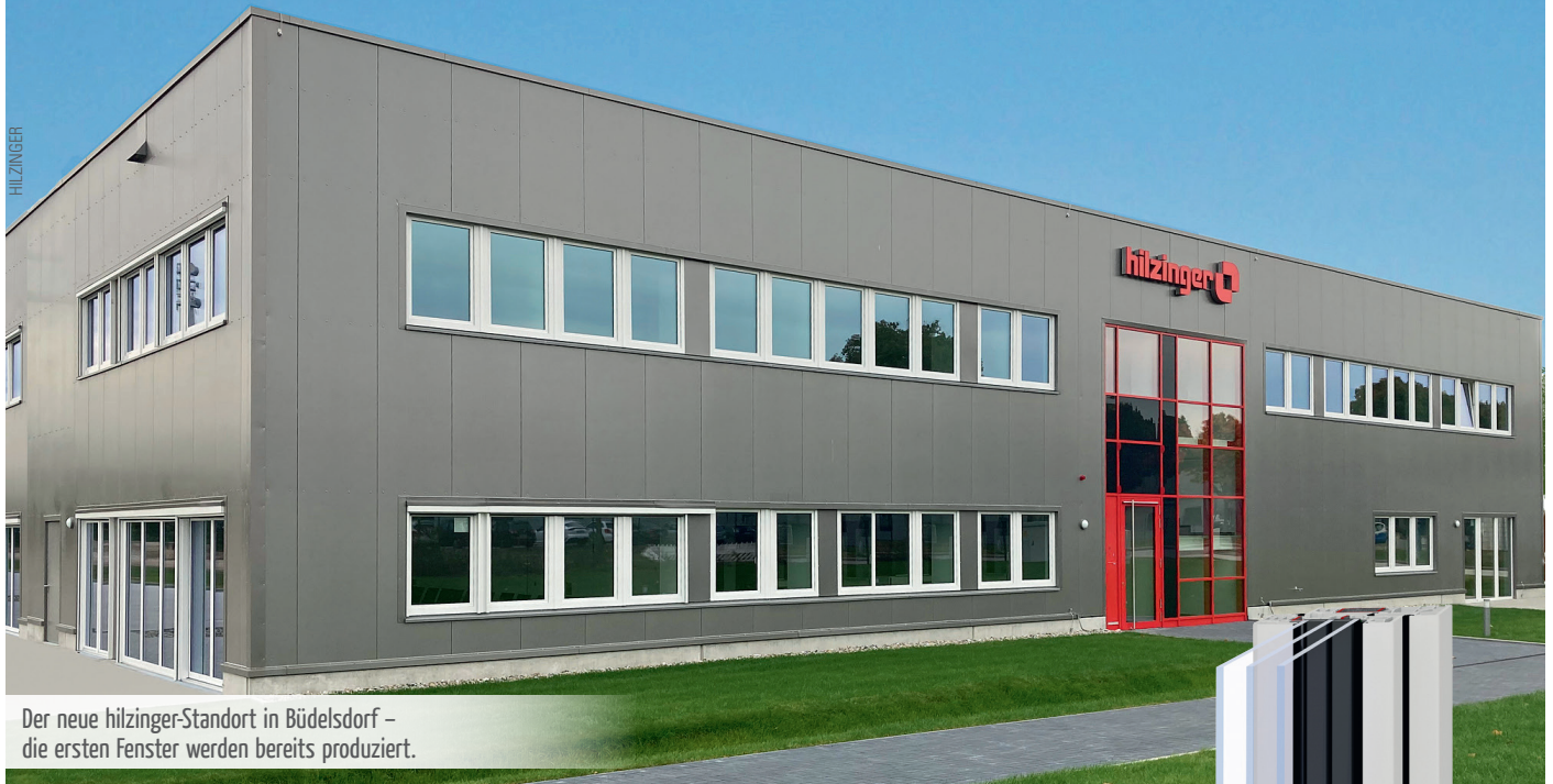
Der neue hilzinger-Standort in Büdelsdorf – die ersten Fenster werden bereits produziert.