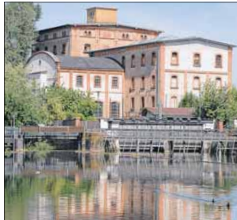
Die Turbinenhalle (links) bleibt bestehen und wird in das neue Verwaltungszentrum integriert.

Über die weiteren Abläufe wie Detailplanung, Baubeginn oder wer Partner bei den Wohnungen wird, entscheidet der Gemeinderat, »denn, so Bürgermeister Steffens, »über das Gesamtpaket beschließt.«