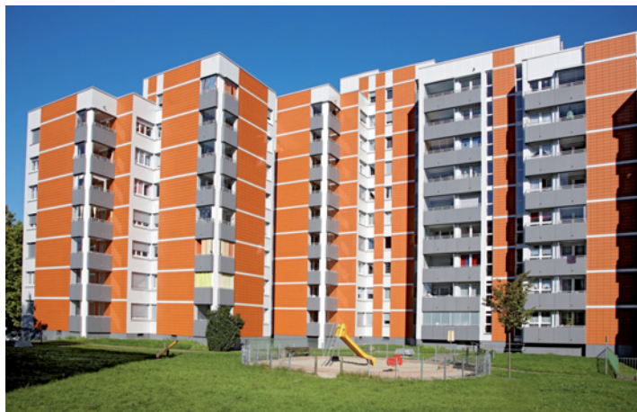
Die Qualitäts-Philosophie zeigt sich auch bei zahlreichen Sanierungs- und Neubauprojekten, wie zum Beispiel in Freiburg (unten), Berlin (Mitte) oder Stuttgart. Hilzinger liefert und montiert bundesweit.