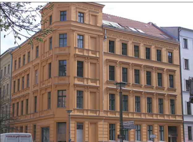
Der Hersteller bietet ein umfangreiches Produktprogramm, darunter auch Lösungen für denkmalgeschützte Gebäude.