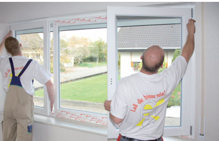
Bei der Fenstermontage letztendlich immer das Wichtigste: erfahrenes Personal, das richtige Werkzeug und abgestimmtes Montagematerial

Ob ein einzelnes Fenster ausgetauscht werden muss oder ob die Fenster für die ganze Wohnung oder das Mehrfamilienhaus erneuert werden – bei Bedarf fertigt Hilzinger zur Abstimmung mit der Bauleitung beziehungsweise dem Auftraggeber CAD-Anschlussdetails und Musterelemente und erstellt ein auf die Situation abgestimmtes Montagekonzept. Besonders in der Modernisierung zählt die Kompetenz des Fachunternehmers. Gearbeitet wird mit speziellem Werkzeug. Wie in der Chirurgie werden die alten Fenster ausgebaut und die neuen montiert. Bei der Abdichtung und Befestigungstechnik arbeiten die Monteure nach den Regeln der Technik sowie einem eigens ausgearbeiteten und aktuellen Montageleitfaden. Das garantiert die bestmögliche Montage. Zur Qualitätssicherung arbeitet das Unternehmen auf Wunsch auch mit Infrarottechnik und Blower-Door-Messtechnik. Zudem beraten die Mitarbeiter über die aktuellen Fördermöglichkeiten, wie zum Beispiel das KfW-Programm „Altersgerecht um-