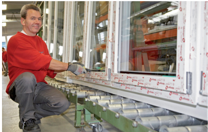
Doch Qualität beginnt bei Hilzinger schon einen Schritt vorher: Der Willstätter Fenster- und Türenspezialist fertigt konsequent nach dem RAL-Gütezeichen für höchste Fensterqualität