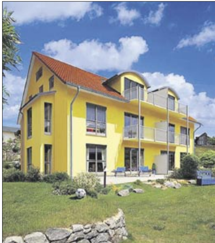
Wohneigentum wird auch im Alter immer wichtiger

in denen man 30 Jahre seines Lebens verbracht hat, entsprechen im Alter nicht mehr den eigenen Bedürfnissen“, weiß OVB-Ex-