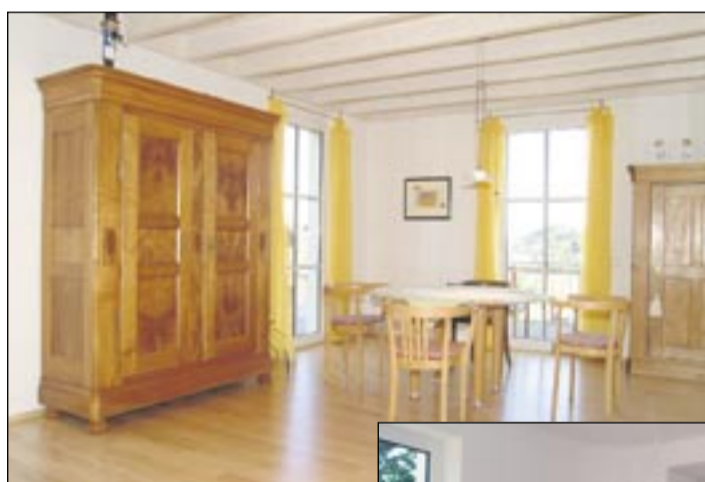
Fenster wirken auf die gesamte Raumatmosphäre

schichtung die organischen Schmutzpartikel. Der Regen bildet einen gleichmäßigen Wasserfilm auf der Scheibe, die deshalb schnell und ohne Schlieren trocknen