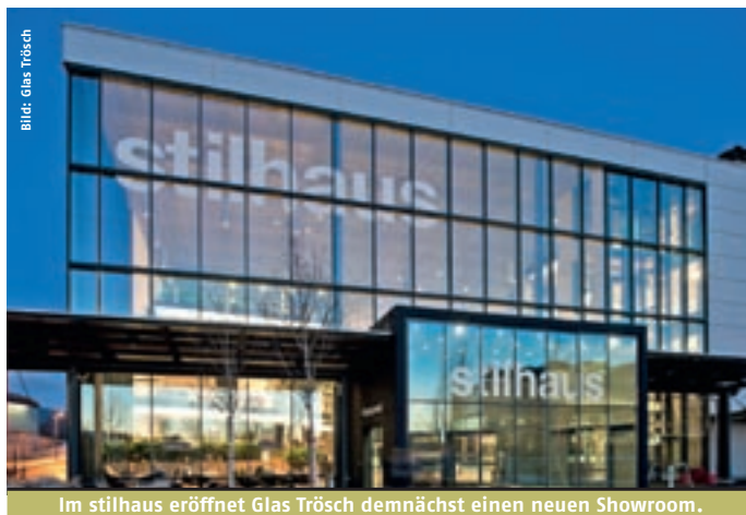
Im stilhaus eröffnet Glas Trösch demnächst einen neuen Showroom.

Im August 2014 beginnt Glas Trösch auf einer Fläche von 870 Quadratmeter mit dem Umbau für seinen neuen Showroom im stilhaus in Rothrist. Die Eröffnung ist für den Spätherbst 2014 geplant. Der neue Glas Trösch-Showroom wird ein breites Portfolio an Glaslösungen für den Innenbereich wie Küchen, Duschen, Trennwände, Türanlagen sowie Möbel umfassen und erweitert somit das bisherige Angebot im stilhaus. Das stilhaus