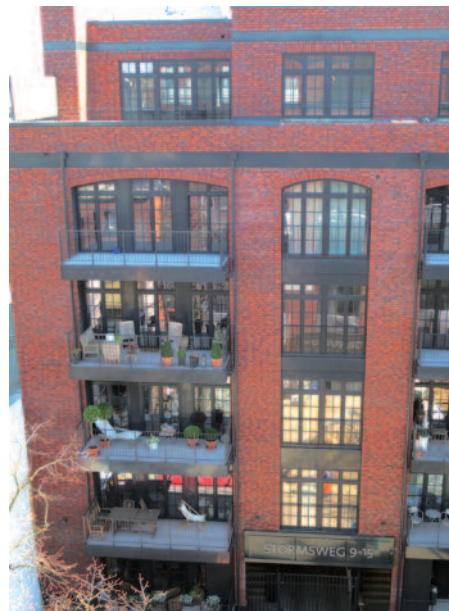
Fenstersanierung in 50 Wohneinheiten in Hamburg, eingebaut wurden farbige Kunststoff-Fenster mit aufgesetzten Sprossen.