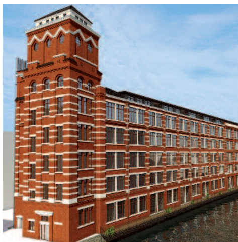
Venezia Quartier Leipzig, Sanierung hochwertiger Eigentumswohnungen mit 700 Hilzinger-Innentüren des Modells „Lino“ mit Oberlicht.