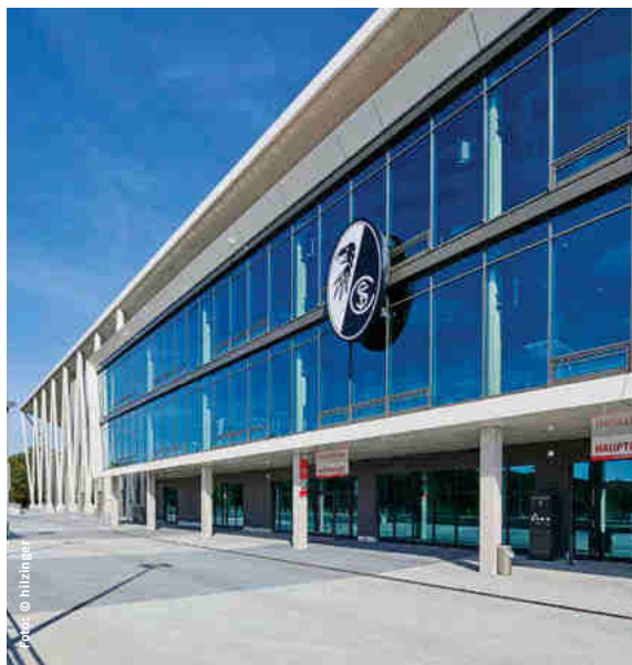
Eine Pfosten-Riegel-Fassade prägt den Eingangsbereich des Stadions und bildet ein elegantes Entree.

(Hessen) können zudem Bleche und Anschlussprofile in allen Varianten gefertigt und gestanzt werden.